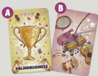
1 트로피 / A 활성 플레이어 카드 B