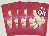
4 OK 카드