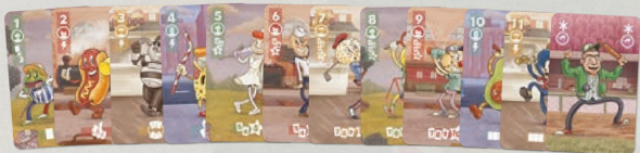
50장 (1-11 및 각 4가지 색상의 플렉스 플레이어와 와일드 코치 카드 2장)