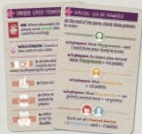
10 플레이 어카드 (플레이어당 2개)